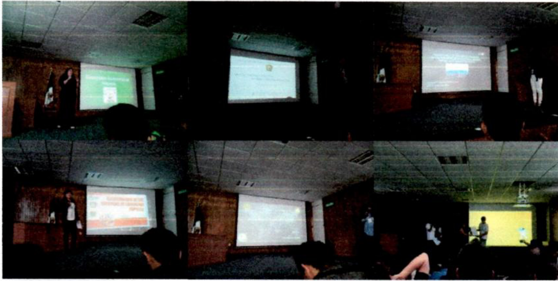
Bloque de Ponencias