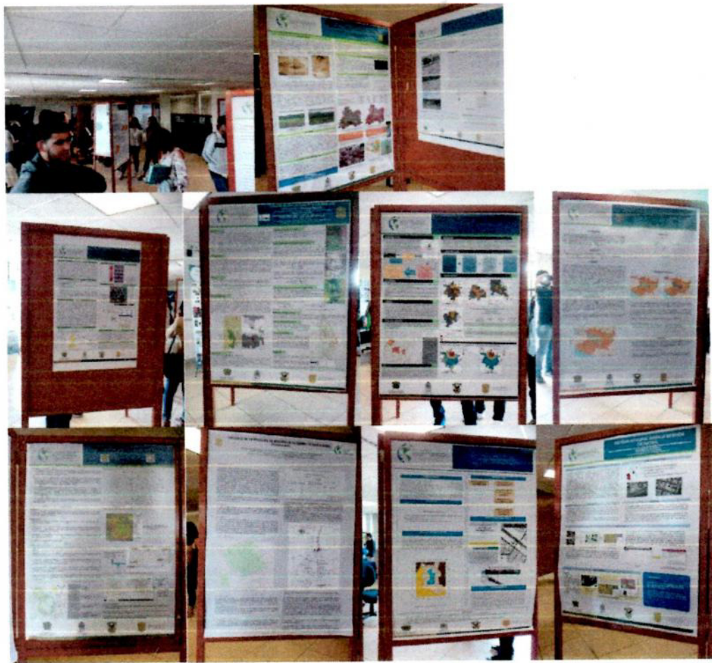
Presentación de Carteles