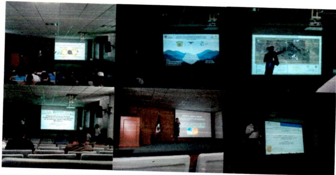
Bloque de Ponencias